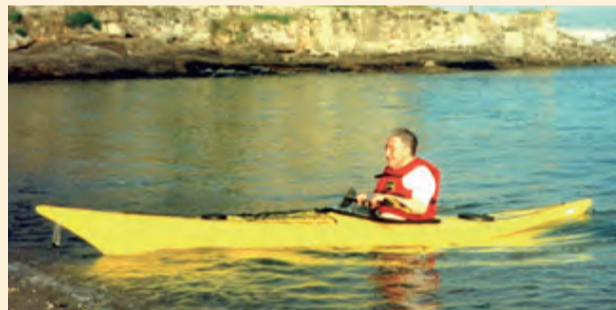
▲帶領來談者認識自我，划向深處，是和神父一生的使命。