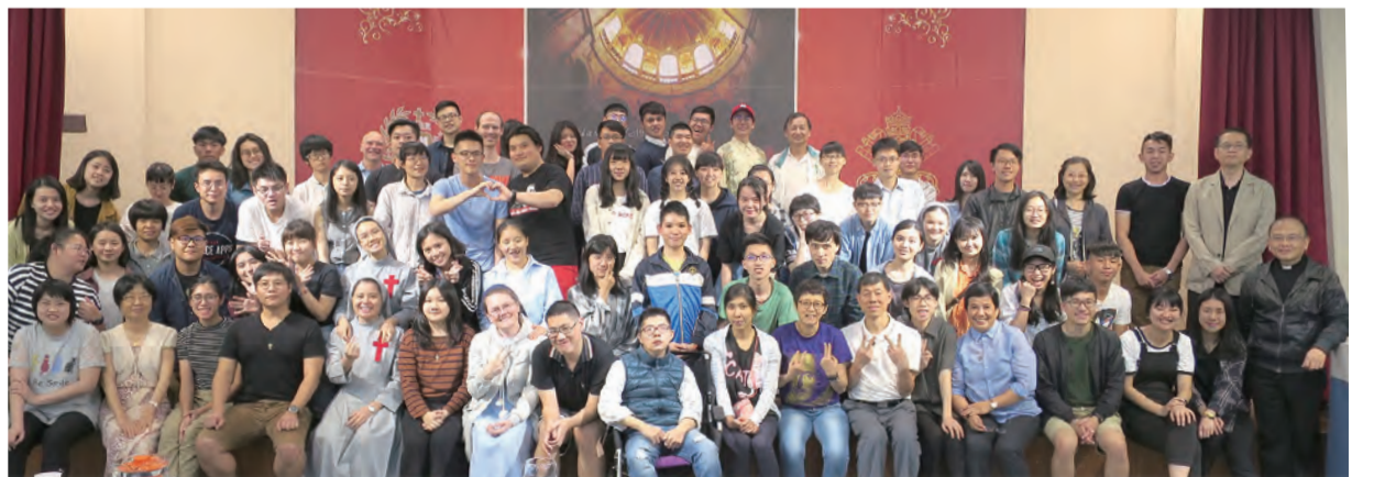
▲天學學程師生及來賓喜樂共融在主內，歡度逾越節。

以上3個法條給了我們一個清楚的概念：「傳教不分身分、地位、職務與方式，而且在任何時候都可以傳教，尤其是在非天主教場合下，更形重要。」這個概念可以說是本學程成立的「磐石」，就讀天學學程的學生在這個基礎上領受這項使命，透過天學學程的陶成，為自己奠立成為基督之光與鹽的基礎。（下期待續）