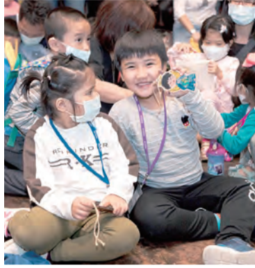
▲孩子開心地展示自己彩繪的天使