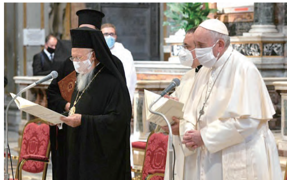
▲教宗方濟各（右）參加第34屆國際和平祈禱聚會

教宗引述了《瑪竇福音》關於「劍」的章節。在耶穌受難前夕，當門徒們給耶穌展示兩把劍時，耶穌回答說：「夠了！」教宗說，這句「夠了」，跨越了幾個世紀直到今天，「劍、武器、暴力、戰爭，夠了！」我們如何才能擺脫被封鎖和