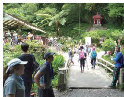
▲從通天橋登山口攀登聖母山莊，成為絡繹不絕的朝聖途徑。

時間：11月9日 9:30 遊行 10:30 感恩彌撒 主禮：鍾安住總主教 地址：宜蘭縣礁溪鄉五峰路 91 巷 10 號