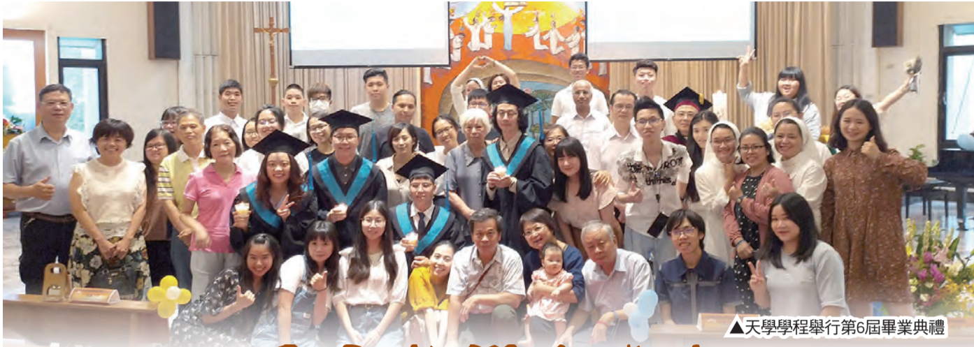
▲天學學程舉行第6屆畢業典禮