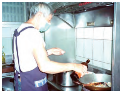
▲水田爺爺大展手藝，令人讚不絕口！

水田爺爺是總舖師，各式各樣的料理都難不倒他。有一天，爺爺走進了最熟悉的市場，表情卻非常慌張，因為他完全忘了來這裡是要做什麼……。水田爺爺的孫女說：「我們家是做吃的生意，一切講求快、狠、準。爺爺的算術無比厲害，每桌客人吃了多少錢？要找多少錢？完全難不倒他。可是，在今天例行回診時做了MMSE（簡易智能評估測驗），93元減7元，爺爺卻算不出來了，爺爺感到非常沮喪，我也是……」