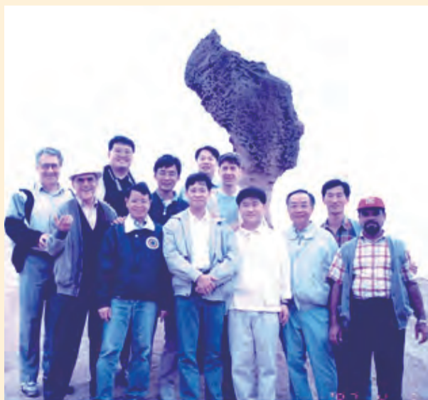
▲樂於與會士們同在的和為貴神父（左）。