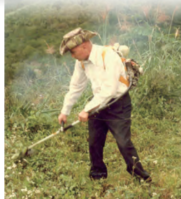
▲巴瑞士修士不辭辛苦，於山野間開疆拓境。