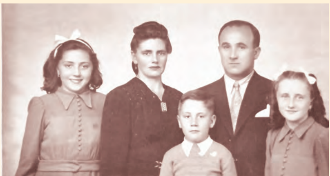
▲和為貴神父幼年時的全家福 ▶1960年，當時的和修士（前排右三）與耶穌會修士弟兄合影。