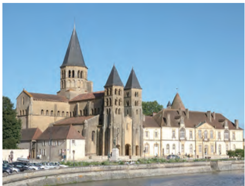
▲法國巴萊毛尼亞的地標——耶穌聖心大殿