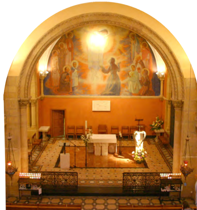
▲顯現堂祭台後方的榮美壁畫