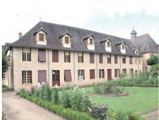
▲坐落於巴萊毛尼亞的聖母往見會院外觀