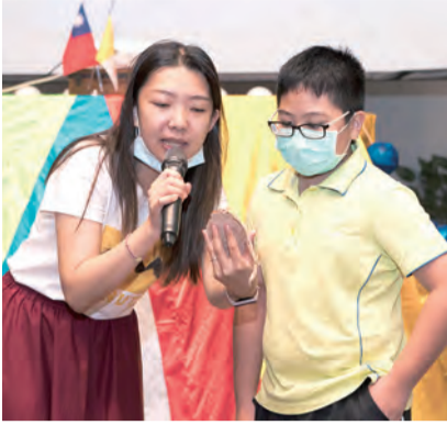
▲孩子介紹自己親手完成的作品