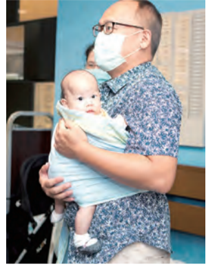
▲親子彌撒最小的參禮者