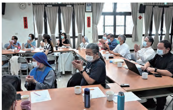
▲主教團家庭工作者秋季會議齊聚一堂，為家庭事工集思廣益。

隨後，依序由各教區家庭委員會或家庭組成員，開始輪流分享明年度的家庭牧靈福傳的工作計畫，涉及的面向除了堂區家庭牧靈的推廣及活動外，各教區也依照自己教區的特色，規畫多項不同的牧靈福傳計畫，有夫婦關係、親