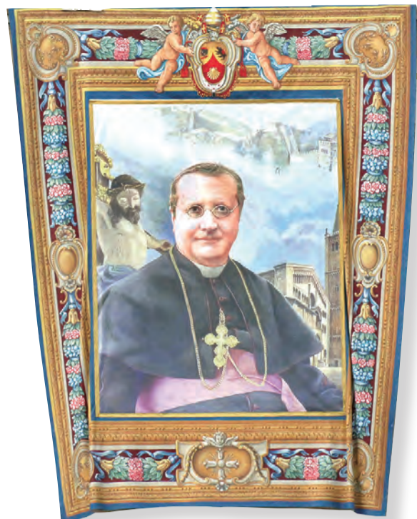
▲聖孔維鐸是拉文納總主教及聖方濟·沙勿略傳教修會的會祖。(Angelo Costalunga 神父繪，蕭保祿攝)

〈聖孔維鐸遺囑信〉的百年回顧與省思 ■文／杜敬一神父(沙勿略會士) 圖片提供 / 聖方濟·沙勿略會