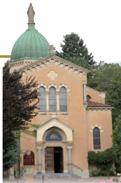
▲高隆汴堂外觀，聖堂內供奉聖高隆汴的聖髑。