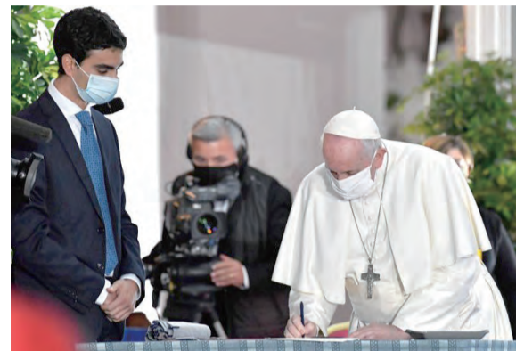
▲教宗方濟各（右）與宗教領袖簽署《羅馬和平呼籲》

陷入泥淖的衝突？如何才能解開這麼多武裝衝突的結呢？教宗進一步闡述：最近新冠疫情大流行給我們的教訓，是意識到我們是在同一條船上航行的世界共同體，一人受害，人人遭殃。我們要牢記沒有人可以靠自己得救，我們只能一起得救。友愛源起於對人類共同體的認可，必須滲入人民的生活、社區、政府層面和國際論壇。如此，人們將越來越認識到，我們唯有通過相遇、談判、停戰、和解、緩和政治和宣傳的語言、發展和平的具體途徑，才能一同獲得拯救。