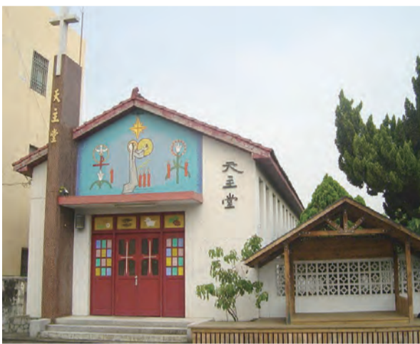
▲甫於10月17日落成啟用的崙背聖母聖心堂，肩負起將福音傳遍崙背、麥寮、橋頭等地區的重大使命。